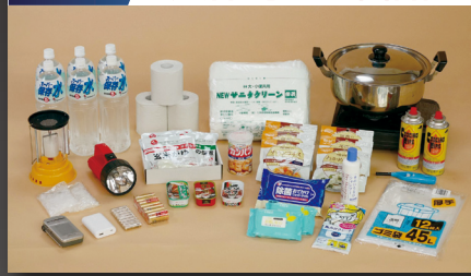
特徴4. 具体的な備蓄品