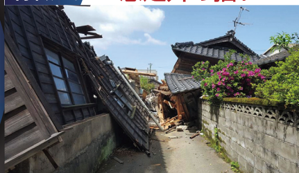
特徴1. 想定外の揺れ